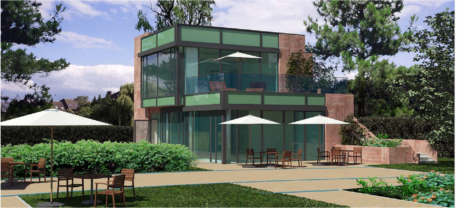
Modelldarstellung des Architekten